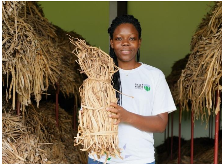
GREEN KEEPER AFRICA